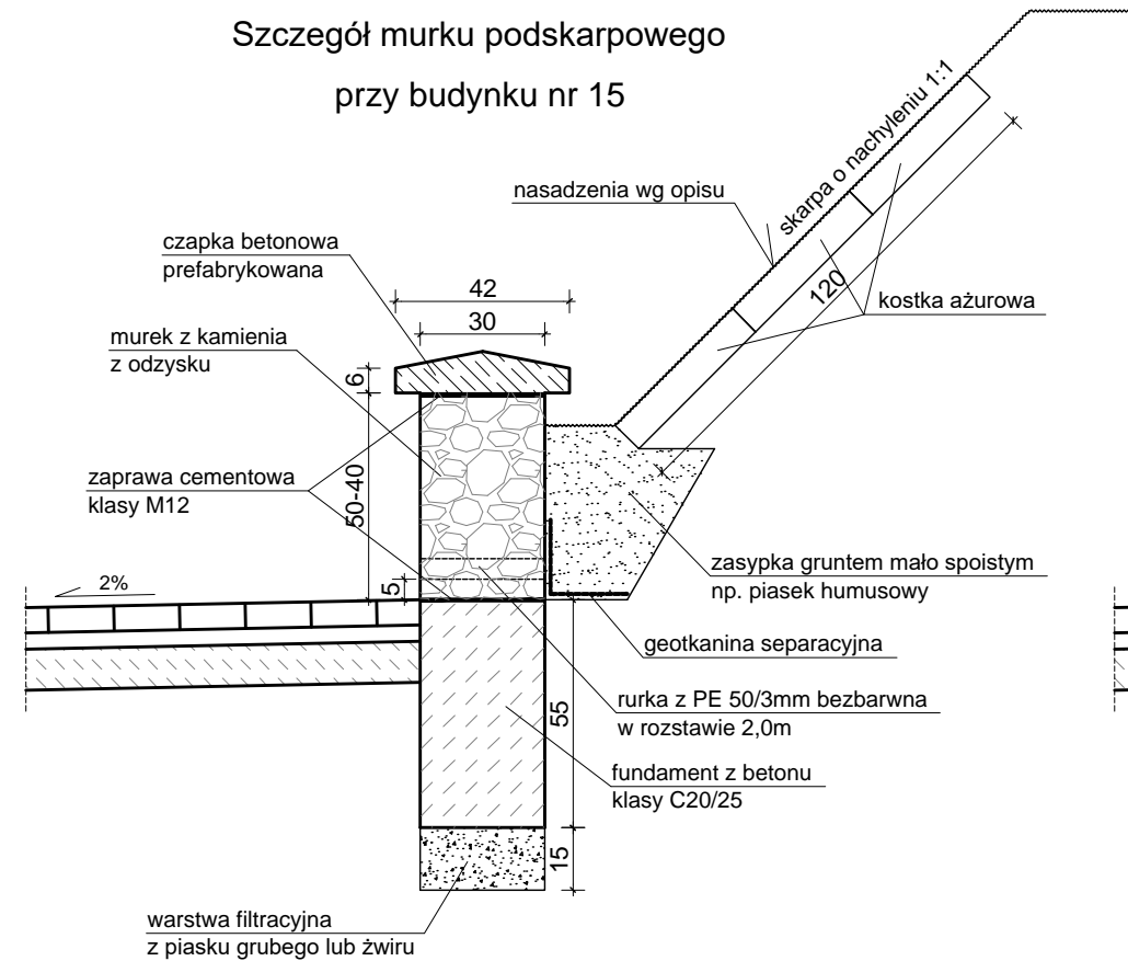
Szczegół murku podkarpowego przy budynku nr 15