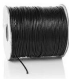
Przewód na rolce