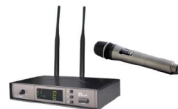
Mikrofon bezprzewodowy (tylko w serii LDPx.0M)