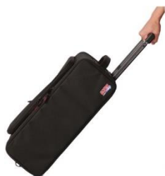
Walizka transportowa ze zintegrowanym wzmacniaczem