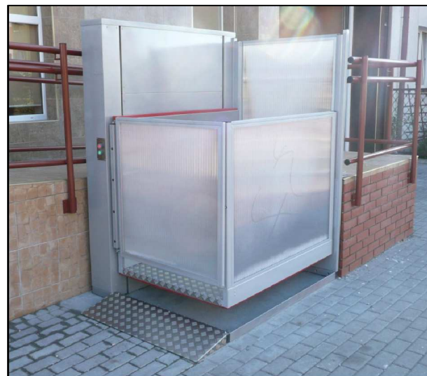
przykład wykonanego podnośnika