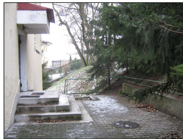
miejsce montażu podnośnika