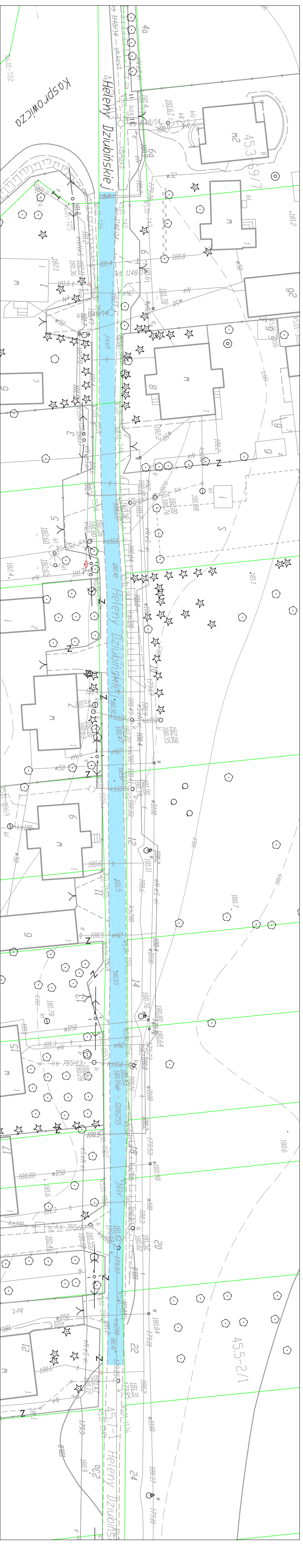
ul. Dziubińskiej odcinek 1